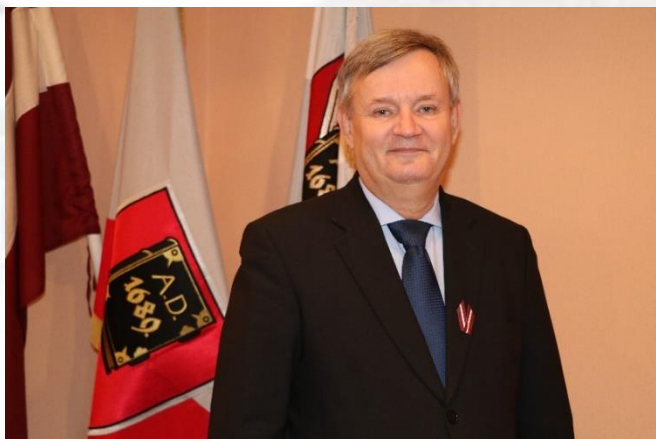
Alūksnes novada domes priekšsēdētājs

I wish a happy new rally season! Let's meet in rally “Alūksne 2020”!