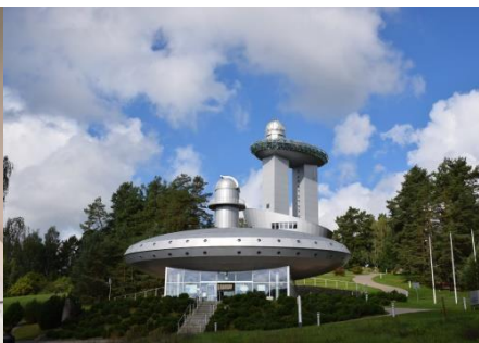
Lietuvos etnokosmologijos muziejus