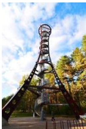
Labanoro regioninio parko apžvalgos bokštas