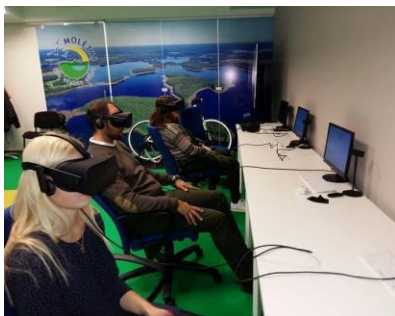
Virtualus edukacinis – istorinis turas „Molėtai kitaip“