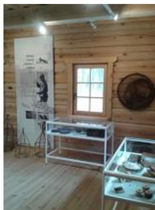
Ežerų žvejybos muziejus ir A. Truskausko medžioklės ir gamtos ekspozicija